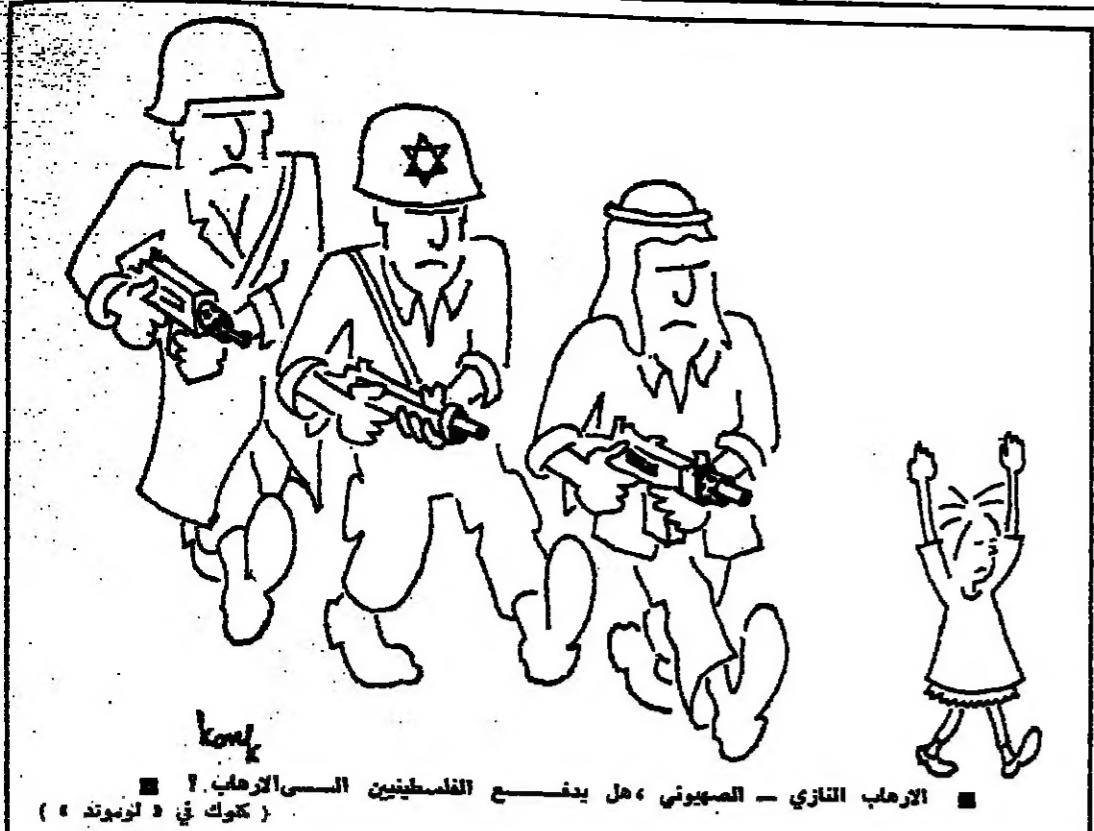
المراتب الثاني - الصهيوني ، هل يدفع الفلسطينيين السراويل ؟ ( كوك في « لوبوند » )

وفي أواسط مسي حياته حمل تطور هام في الحركة الصهيونية ، إذ بدأ يستعدا للقول بتأسيس وطن لليهود في غير فلسطين ، وبال إلى القبول بمناطق أفريقية ، تشكل يومئذ اليوم . وقد عارض جناح كبير في الحركة